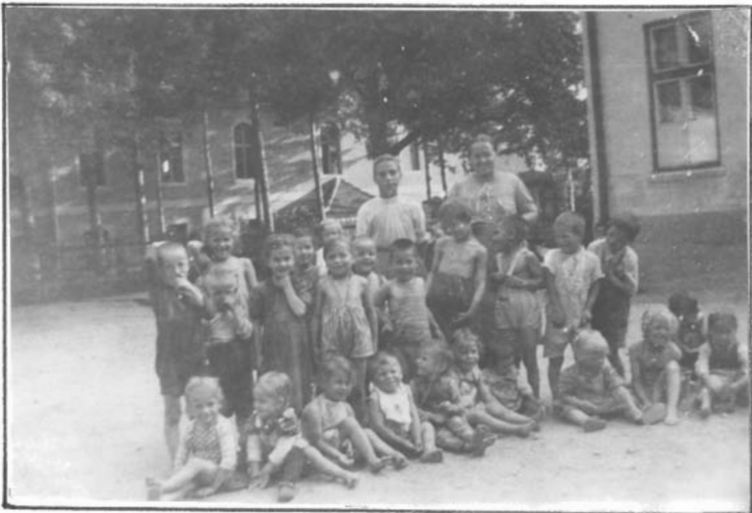
Kindergarten in Talmesch 1942 oder 1943

(Fortsetzung und Schluß in der nächsten Ausgabe)