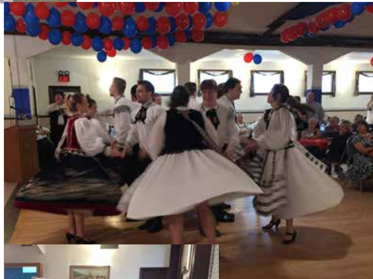
Die kanadische Tanzgruppe bei ihrem Auftritt