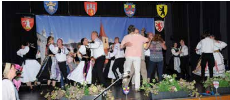
Talmescher Tänzer gemeinsam mit der Tanzgruppe

– die Augen mancher Anwesenden wurden feucht. Der großen und vielseitigen Tombola erfreuten sich viele Besucher.