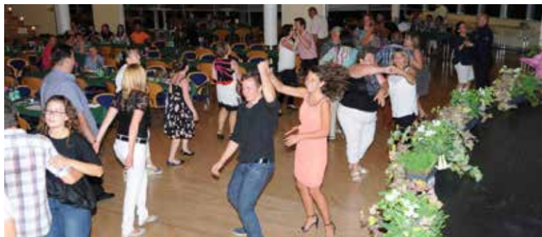
Partystimmung zur späten Stunde

Wir bekamen viele positive Rückmeldungen. Das