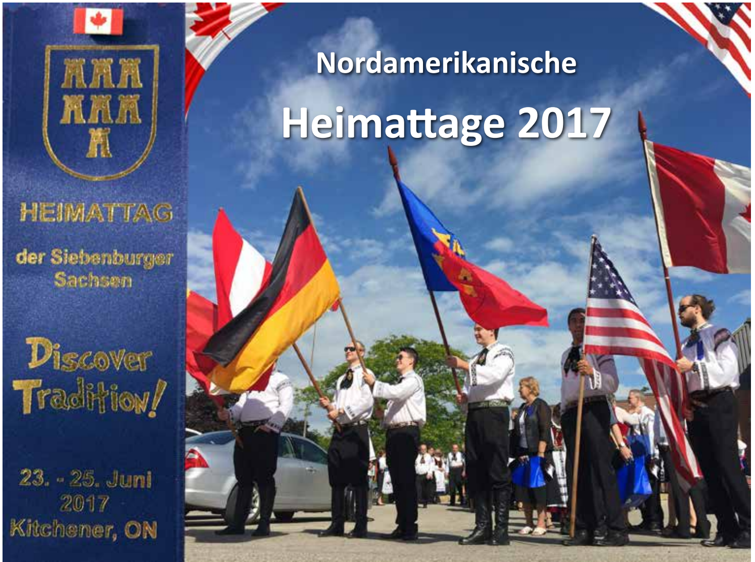
Fahnenträger vor dem Einmarsch in die Festhalle