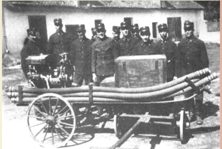
Die Motorspritze und einige Feuerwehrleute im Hof der Gemeindekanzlei in Talmesch

arbeiten. Das Feuer wurde zunächst eingedämmt und später mit Hilfe der Hermannstädter Feuerwehr ganz gelöscht.