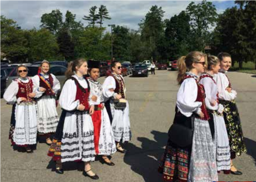
Die Vielfalt von siebenbürgischer Tracht