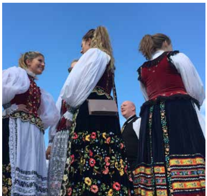
Nordsiebenbürgische Tracht mit ihren buntbestickten Samträcken