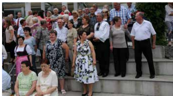
Talmescher Gäste beim Aufstellen für das Gesamtfoto

Um 15:00 Uhr folgte ein weiterer bewährter Ablauf: Der Termin für das offizielle Gesamtfoto 2 der Anwesenden stand an. Vor der Stadthalle wurden die Talmescher vom Fotografen hin- und herdirigiert, bis jeder gut im Blickfeld war. Und auch dieses Jahr entstand ein unvergessliches Foto, das die Gäste am späten Abend käuflich erwerben konnten. 2