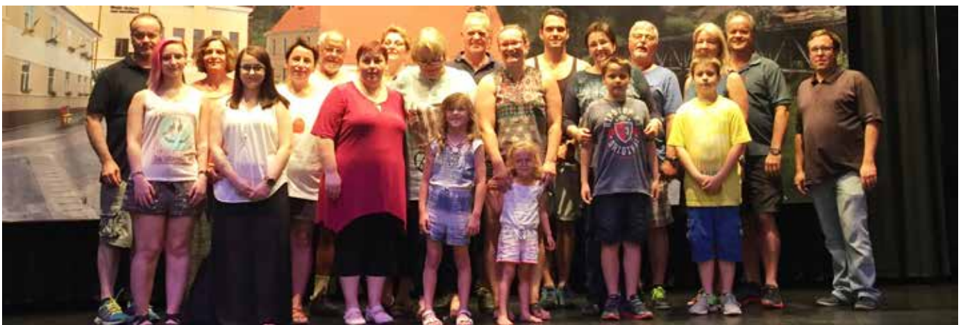
Das gesamte Aufbauteam zum Talmescher Treffen 2017