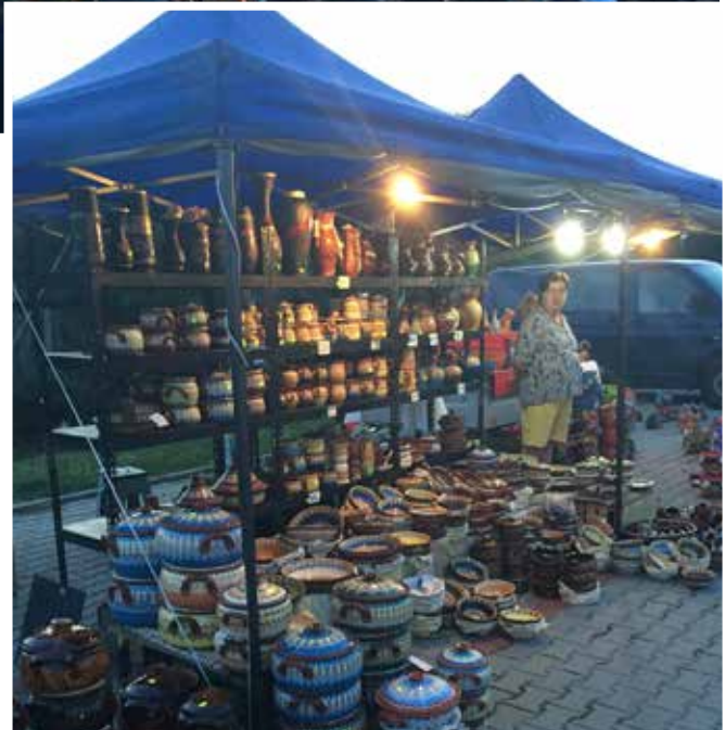
Folklore auf der Bühne, Essensspezialitäten, bunte Töpfereien und Hüpfburg für die Kleinen