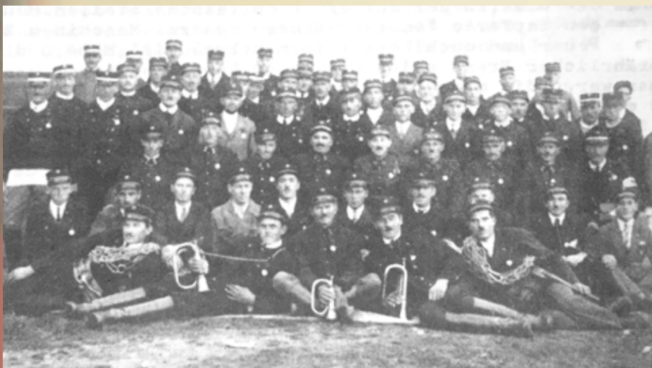
Die Freiwillige Talmescher Feuerwehr Gruppenbild 1930