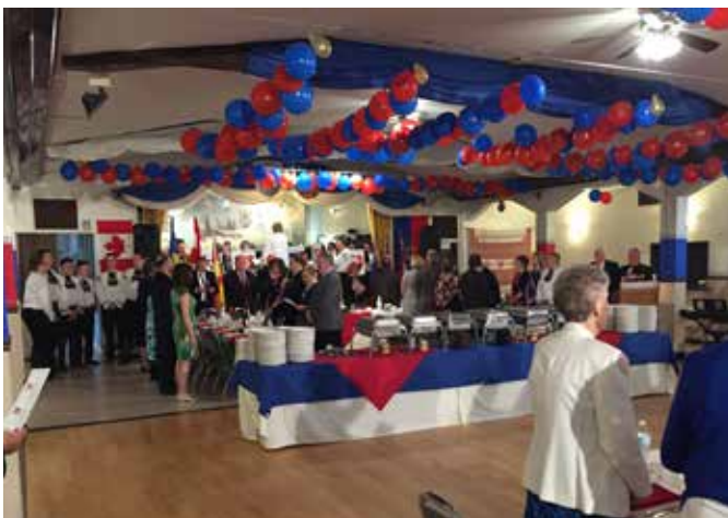
Gäste des Heimattages beim Singen der Nationalhymnen

Die Jugendtanzgruppe Kitchener präsentierte sich noch-