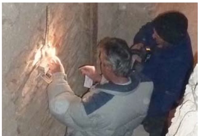
Motorantrieb der kleinen Glocke