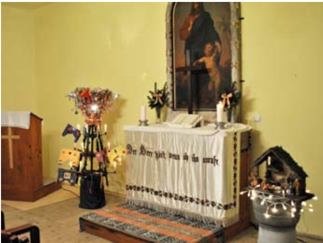
Festlich geschmückter Altar mit Christleuchter u. Krippe

geliums, die mit der Verkündigung der Geburt Jesu durch die Engel begann: „Fürchtet euch nicht, euch ist heute der Heiland geboren“ und der Predigttext aus dem Johannesevangelium: „Denn also hat Gott die Welt geliebt, dass er seinen eingeborenen Sohn gab, damit alle, die an ihn glauben, nicht verloren werden, sondern das ewige Leben haben“, waren die Weihnachtsworte an die Gemeinde.