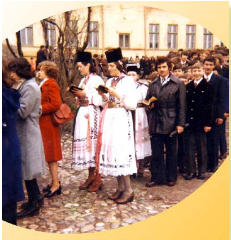
Ostersonntag 1980 - Umzug auf den Pfarrhof