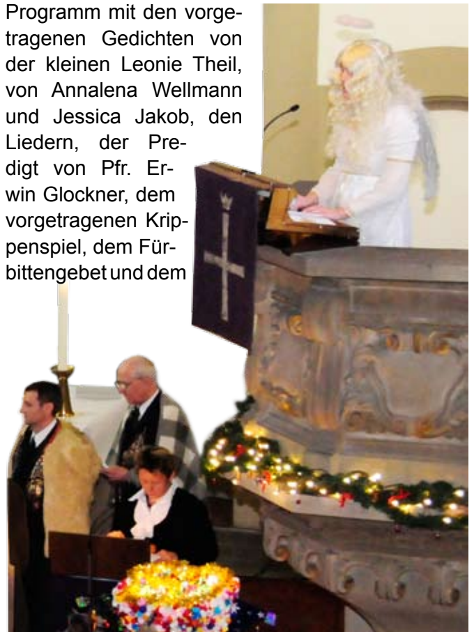
Die Hirten, der Engel und der Erzähler beim Krippenspiel