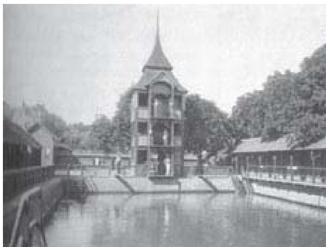
Schwimmschule mit Sprungturm, Fotos: H. G. Roth

Wie oft bin ich hier herumgestreift, um die ersten Frühlingsblumen zu pflücken: Buschwindröschen, Hundszahn und Wilde Wicke. Und am Ersten Mai liefen wir Buben unserer Gasse hierher, „den Maien zu hauen“, um das junge Buchengrün auf die Plankentore zu stecken und dadurch die Gassenfronten beider-