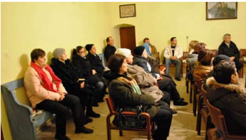
Kirchengemeinde am Heiligabend