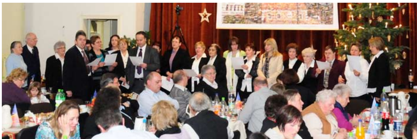
Talmescher singen gemeinsam „Stille Nacht, heilige Nacht“

Wir möchten uns ganz herzlich bei den vielen Helferinnen und Helfern bedanken, die solche Feste nicht nur mitorganisieren, sondern auch für die Durchführung sowie den Auf- und Abbau verantwortlich sind. Ohne sie wäre dies nicht möglich! Allen, die trotz