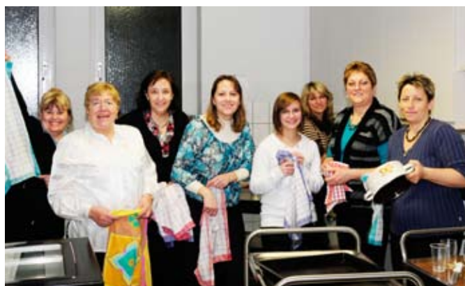
Die fleißigen Helferinnen beim Aufräumen in der Küche

Der mit Tannenzweigen, Weihnachtskerzen und dem Christleuchter festlich dekorierte Gemeinderaum lud zur Einkehr ein und trug zur Einstimmung auf die bevorstehenden Feiertage bei. Den Gästen bot sich mit dem 2,5 m großen Kirchenmosaikbild ein besonders sehenswerter Anblick. Das Bild, das aus über 1000 Einzelfotos bestand, wurde von Wilhelm Wellmann durch viel Fleißarbeit zusammengestellt. Das gedämmte Licht, die Kerzen auf den Tischen und der Duft des Weihnachtsgebäcks, der durch den Raum strömte, sorgten für die festliche Weihnachtsatmosphäre, als die bekannten Weihnachtslieder gemeinsam gesungen wurden.