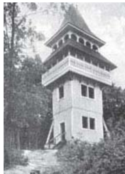
Der Aussichtsturm im Tannenwald

Wie oft bin ich hier herumgestreift, um die ersten Frühlingsblumen zu pflücken: Buschwindröschen, Hundszahn und Wilde Wicke. Und am Ersten Mai liefen wir Buben unserer Gasse hierher, „den Maien zu hauen“, um das junge Buchengrün auf die Plankentore zu stecken und dadurch die Gassenfronten beider-