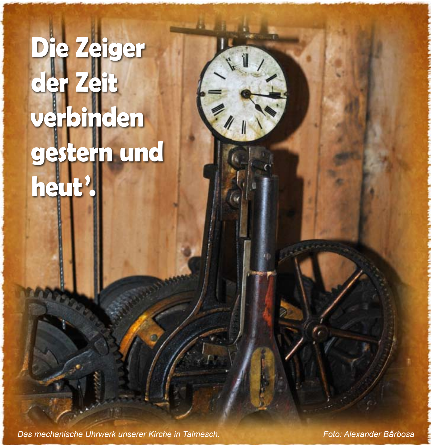
Das mechanische Uhrwerk unserer Kirche in Talmesch.

Die Zeiger der Zeit verbinden gestern und heut'.