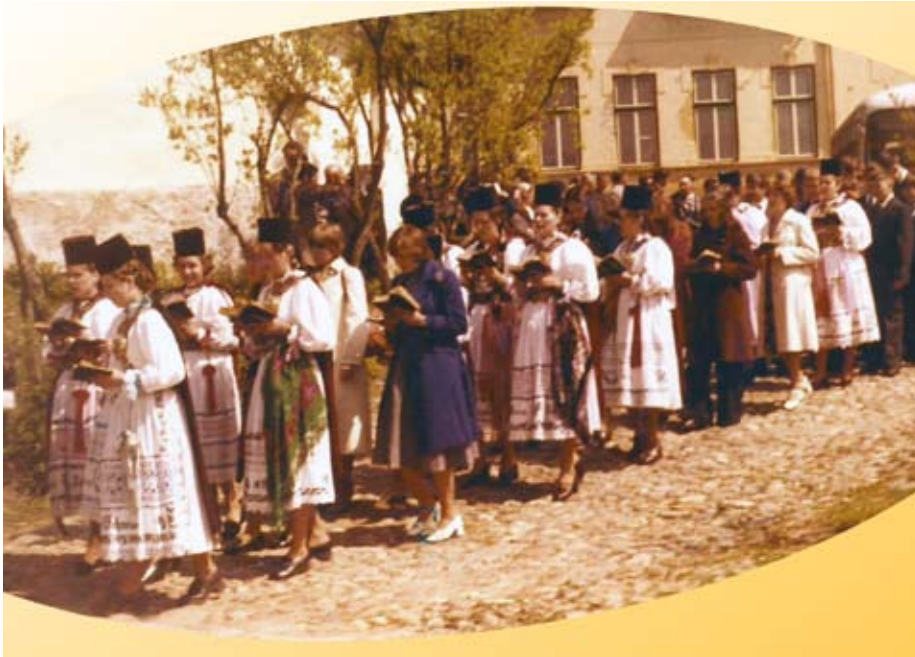
Ostersonntag (Jahr unbekannt) Umzug auf den Pfarrhof

Die jungen Mädchen in festlicher Tracht, als Schönheit von Talmesch – welche Pracht! Auch ein Brautpaar und junge Männer in Scharen – wie glücklich sie alle doch waren! Damals waren wir alle noch jung. Was für immer bleiben wird, ist die unvergessliche Erinnerung.