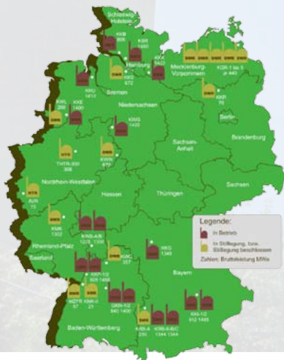
Graphik AKW-Standorte: Quelle Bundesamt für Strahlenschutz

Rechnerisch genau erfasst und wissenschaftlich erwiesen ist jedoch die schockierende Folge von frei gewordenem Plutonium. Das ist der gefährlichste Stoff, der in Kernkraftwerken entsteht. Aus Uran wird bei der Kernspaltung Plutonium. Ein Millionstel Gramm, das eingeatmet wird, hat Krebs zur Folge. Bis zu eine Million Lungenkrebsfälle kann