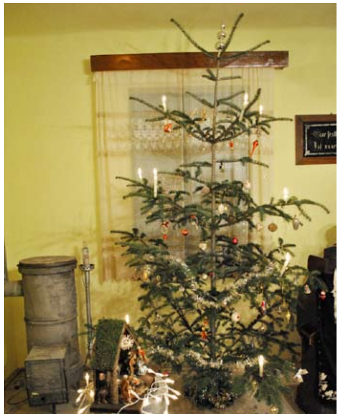
Geschmückter Weihnachtsbaum in der Sakristei

Der Weihnachtsgottesdienst wurde von Pfr. Ger-