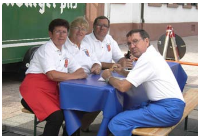
Eine Ruhepause nach getaner Arbeit

Für 2010 planen wir einen weiteren kleinen Stand im Dezember am Lampertheimer Weihnachtsmarkt. Dabei möchten wir gerne weitere Spezialitäten aus unserer schönen Heimat Siebenbürgen präsentieren. Freunde von nah und fern sind eingeladen,