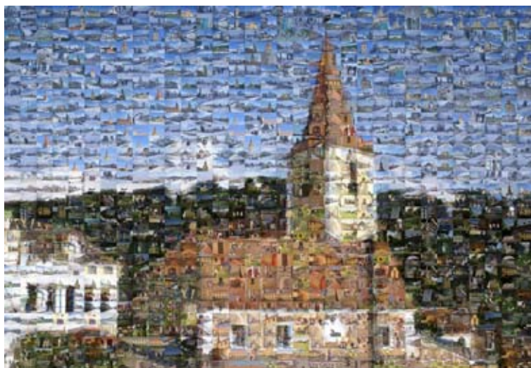
Mosaikbild aus über 1000 Einzelfotos

Weihnachtssegens regte die Gäste zur besinnlichen Einkehr an.