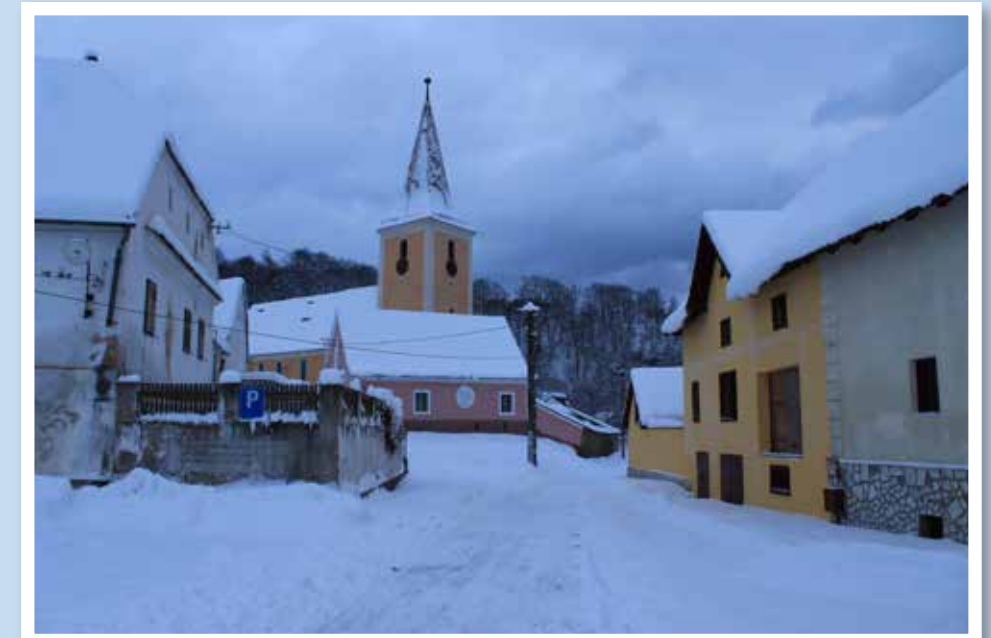
Klirrende Kälte und der schneebedeckte Weg, der zur Kirche führt. Pfarrhaus, Rektorenhaus, Kirche mit Kirchturm und Mühle