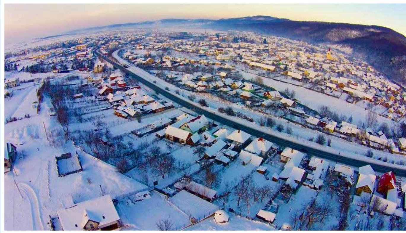
Talmesch im Winter - aus der Vogelperspektive Großer Überblick bei klaren Sichtverhältnissen. Rechts der Kirchturm, der alles überragt.