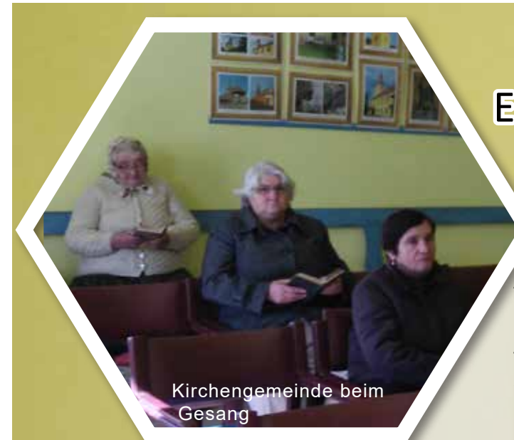
Kirchengemeinde beim Gesang