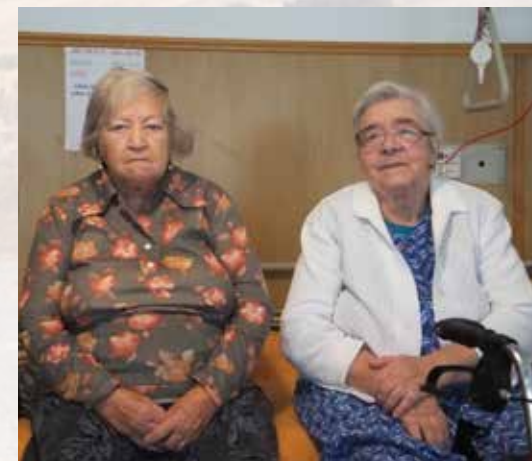
Susitante und Annatante im Altenheim

Einander ermutigen und Freude bereiten ist das Motto, das ich von meinen Eltern gelernt habe. Die beste Quelle sind die Verheißungen und Wahrheiten aus Gottes Wort. Ich darf sie für mich persönlich in Anspruch nehmen und dann weitergeben an andere. Diese Quelle versiegt nie, und das Wasser ist immer frisch. Die Wirkung ist sicher: Der Friede Gottes füllt die leeren durstigen Stellen unserer Herzen.