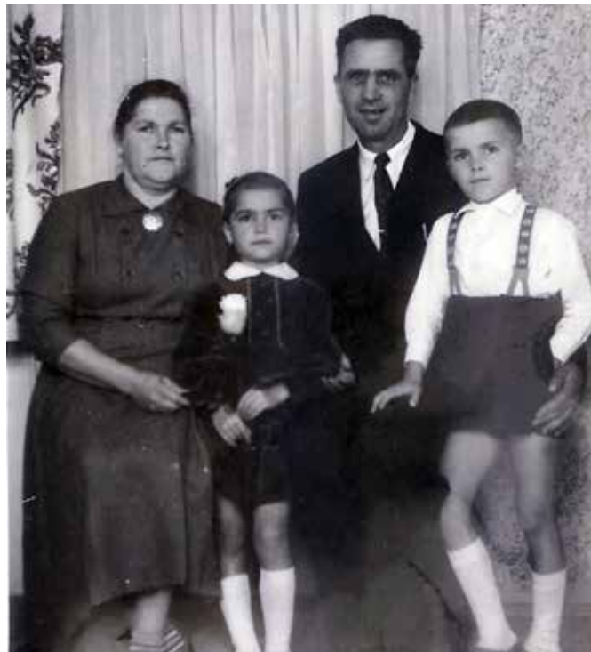
Die Fakeschs um 1963

gleichen Jahr „zum Grainst“, auf die Hauptstraße, in das Haus, das früher dem Zinken-Hännes-Ingm gehörte. Bis zum gesetzlichen Rentenalter habe ich – neben der Betreuung der Kinder – in der Talmescher Zwirnfabrik ‚Firul Roșu‘ (Roter Faden) gearbeitet, um zur Finanzierung unseres Lebensunterhalts mit beizutragen und etwas für die Rente zu tun. Das Leben in Talmesch war einfach, aber schön. Insbesondere das gute nachbarschaftliche Verhältnis dort hat uns allen gefallen und gutgetan.