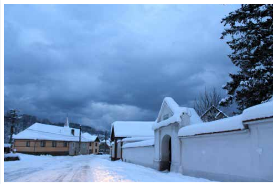
Alles schneebedeckt - wie im Märchenland rechts: der Talmescher Friedhofseingang - Ort der Ruhe