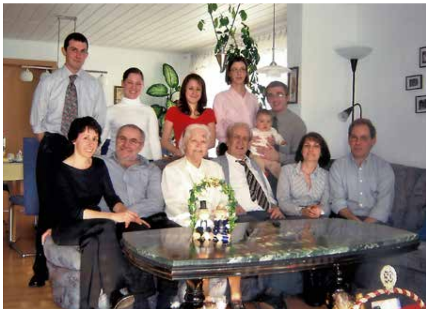
Goldene Hochzeit (Januar 2006) mit Großfamilie Fakesch – 4 Generationen

Seit einiger Zeit lebe ich nun in Rastatt, in einem Pflegeheim, wo mich die Kinder regelmäßig besuchen und freue mich immer, wenn ich