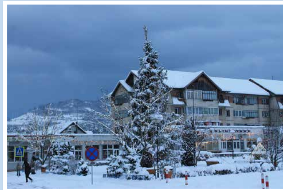
Der weihnachtlich geschmückte Baum im verschneiten Stadtzentrum.