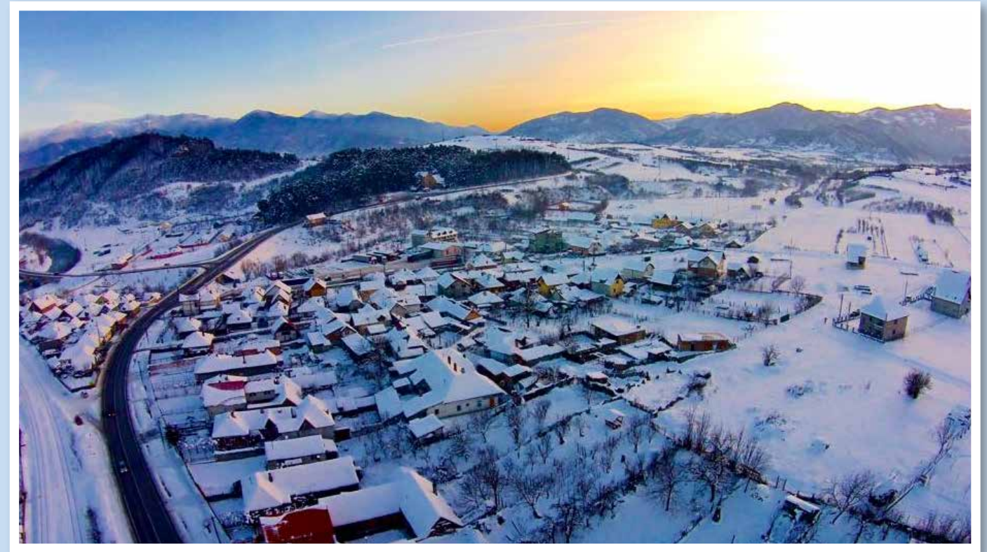
Talmesch im Süden: Die Burg, der Fichtenwald und die Europastraße in Richtung Boița.